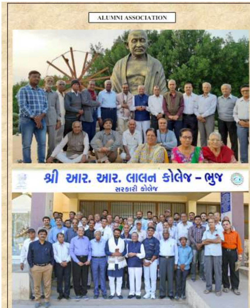
Alumini gathering with present MP Shri Vinodbhai Chavda (Alumini of college)