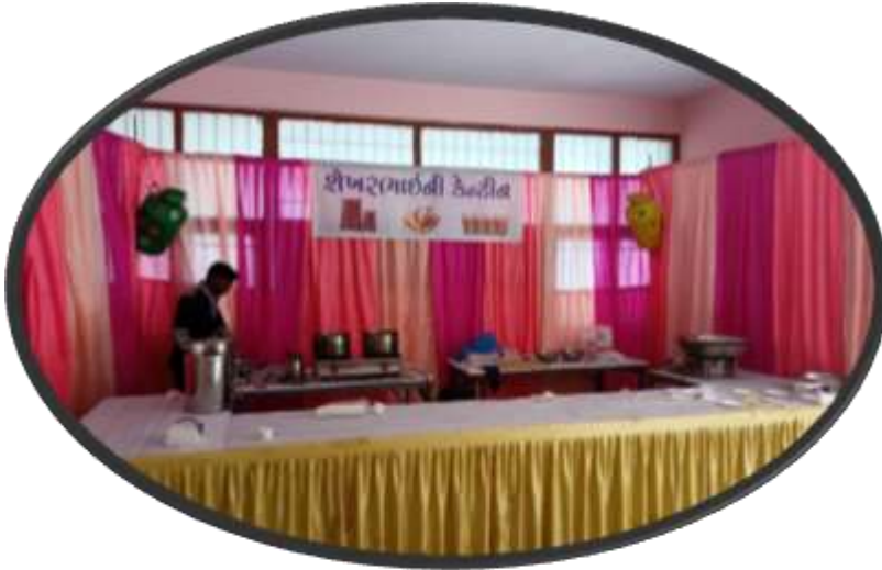
Recreation of Old canteen during the event