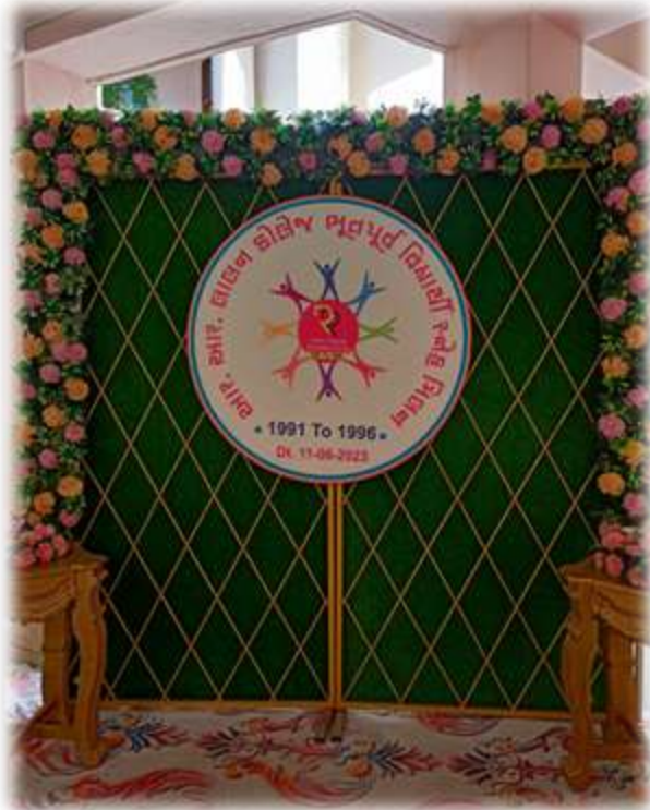
A selfie point