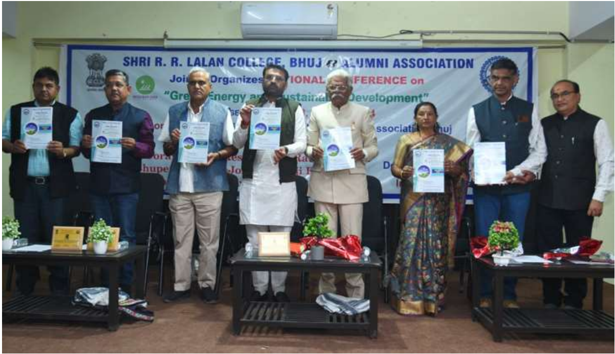
Association meet during June 2023